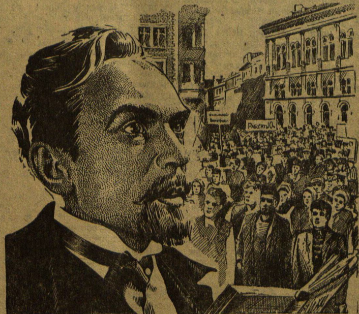
Сеансы с 2 часов дня до 10 часов вечера.